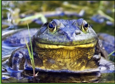
Mâle adulte de grenouille taureau

La grenouille taureau doit son nom à son chant en série de meuglements sourds. Elle pèse entre 600 et 800g et mesure 20cm du museau au cloaque chez l'adulte, auxquels il faut ajouter jusqu'à 25 cm de pattes en extension. C'est la plus grosse grenouille de France.