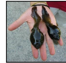
Les têtards peuvent mesurer plus de 15 cm